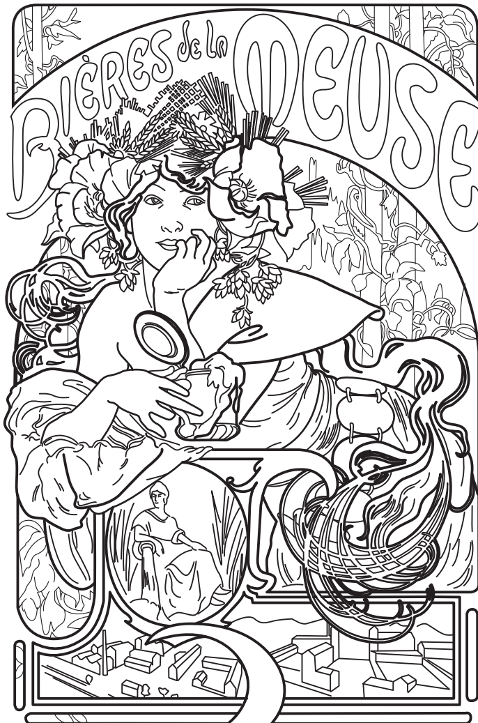
Alfonz Mucha: Bieres de la Meuse, 1897

Skús aj ty navrhnuť reklamu na predmet/vec, ktorá je pre teba dôležitou súčasťou týchto dní. Dokresli plagát na druhej strane. Môžeš si vymyslieť slogan, dokresliť predmet do ruky postavy aj reklamnú tvár. Alebo doň dolep vlastnú fotografiu :)