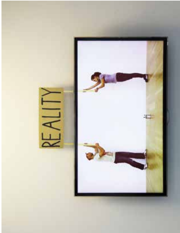
Nika Oblak & Primož Novak: Škatuľa , 2005 pneumatická videoinštalácia, majetok autorov