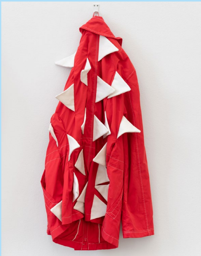
Eva Koťátková: Miestnosť pre reštaurovanie empatie / Room for Restoring Empathy , 2019, mediálne rôznorodá inštalácia / mixed media installation, kov, textil, šnúra, variabilné rozmery / metal, fabric, string, variable dimensions, detail / details, záber z výstavy Spoveď potrubného systému / Confessions of the Piping System , Kunsthal Charlottenborg, Kodaň / Copenhagen