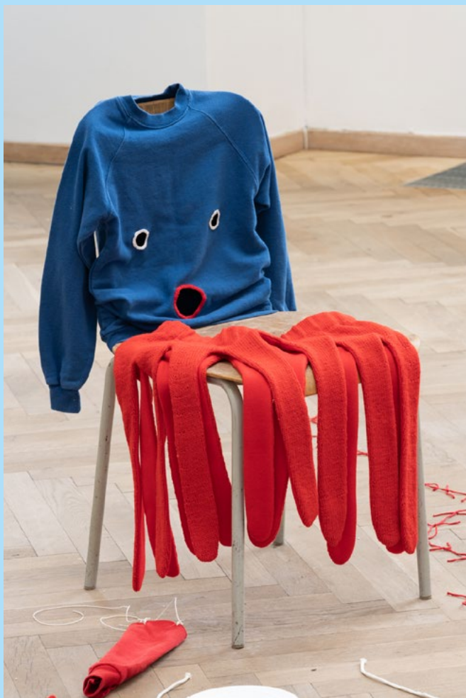
Eva Kořátková: Priestor pre obnovenú empatiu / Room for Restoring Empathy , 2019, mediálne rôznorodá inštalácia / mixed media installation, kov, textil, šnúra, variabilné rozmery / metal, fabric, string, variable dimensions, záber z výstavy Spoved' potrubného systému / Confessions of the Piping System , Kunsthal Charlottenborg, Kodaň / Copenhagen