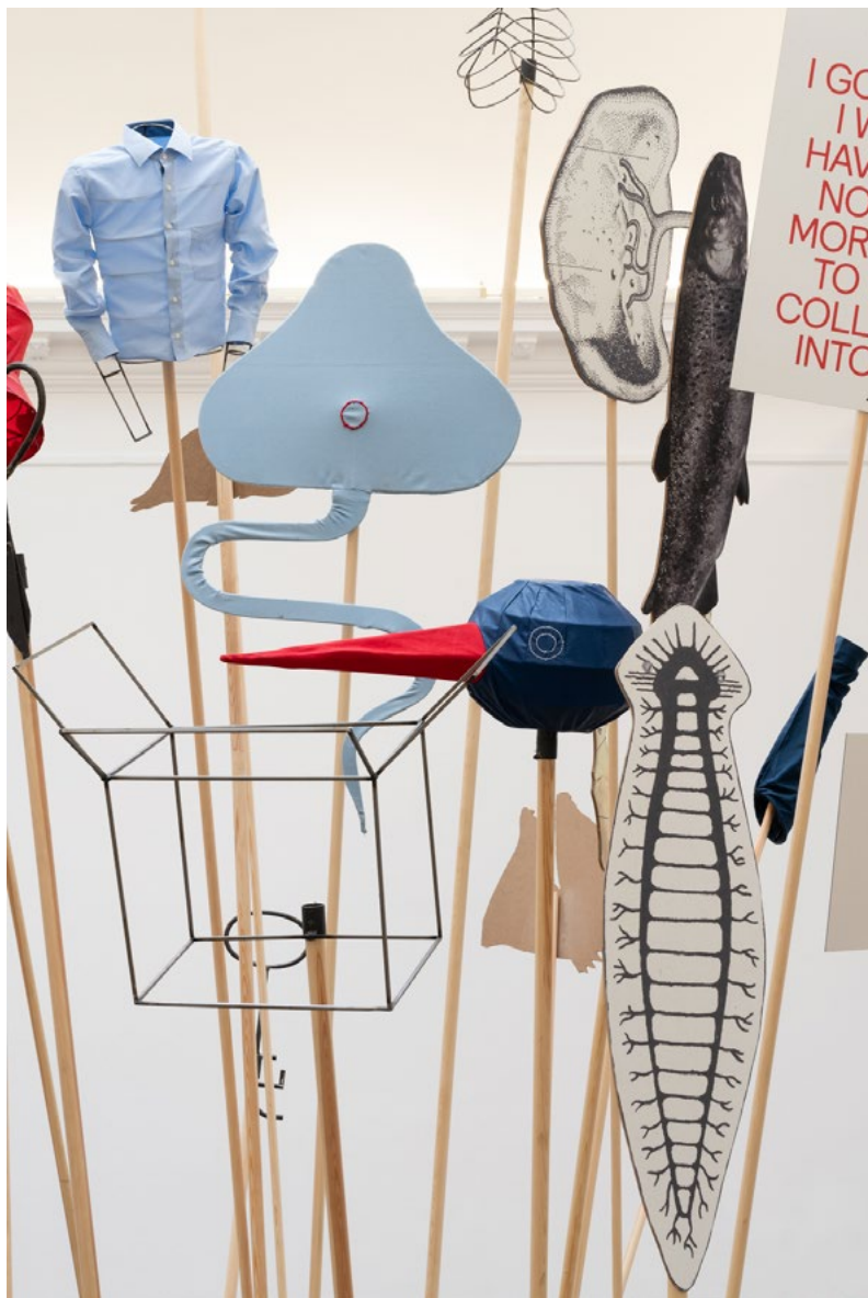
Eva Koťátková: Spoved' potrubného systému / Confessions of a Piping System , 2019, mediálne rôznorodá inštalácia v kombinácii s perormanciou / mixed media installation combined with performance, kov, digitálna tlač na kartón, drevo a textil / metal, digital print on carton, wood, fabric, záber z výstavy Spoved' potrubného systému / view from the exhibition Confessions of the Piping System , Kunsthal Charlottenborg, Kodaň / Copenhagen, foto / photo: David Stejnholm