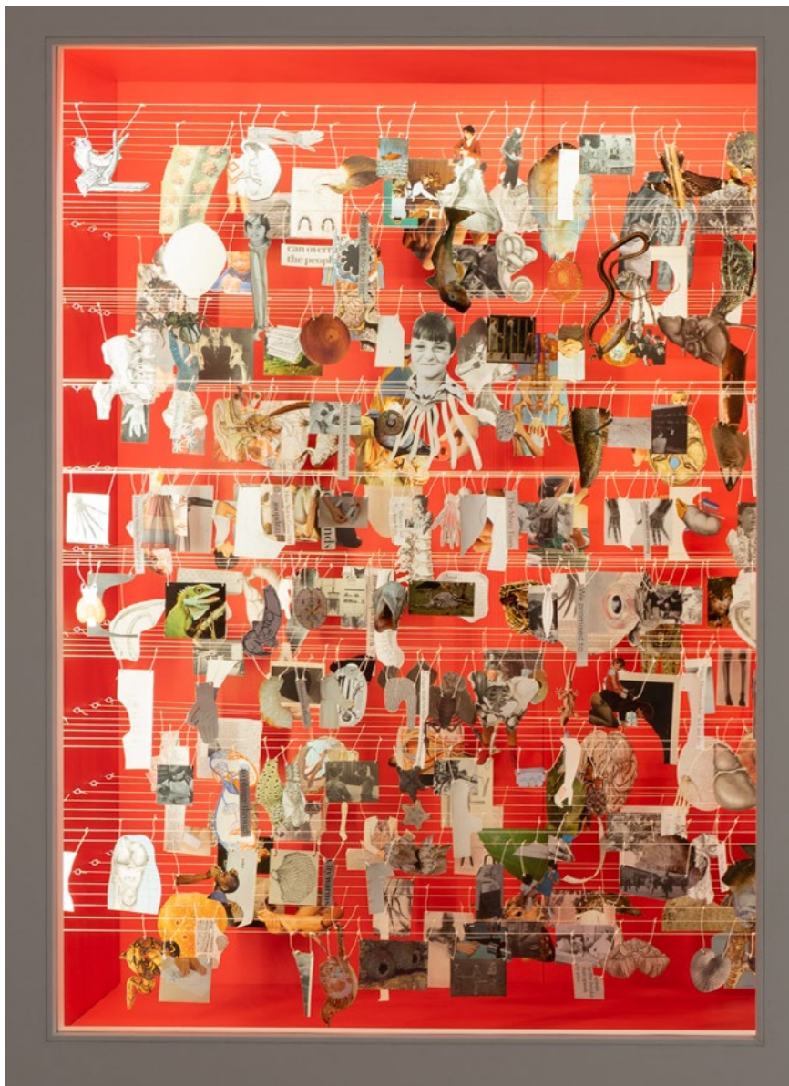
Eva Kořátková: Chyba / Error , 2019, mediálne rôznorodá inštalácia / mixed media installation, vitrina s papierovými výstrižkami, šnúra, svetlo / vitrine with paper cutouts, string, light, záber z výstavy Spoved' potrubného systému / view from the exhibition Confessions of the Piping System , Kunsthal Charlottenborg, Kodaň / Copenhagen, foto / photo: David Stejnholm