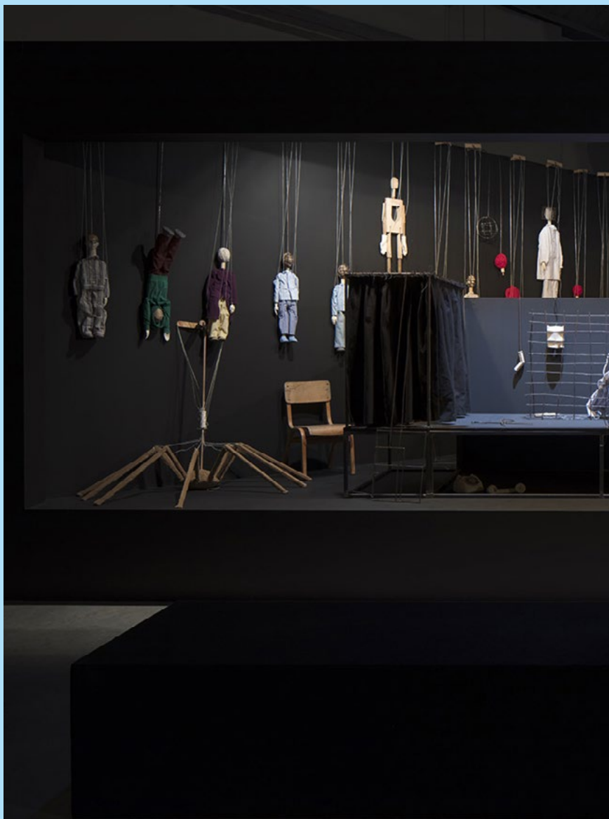
Eva Košťátková: Diár č. 2 (I-zviera) / Diary no.2 (I-Animal) , 2018, mediálne rôznorodá inštalácia / mixed media installation, vitrína, šnúra, papier, svetlo / vitrine, string, paper, light; záber na inštaláciu v Pirelli HangarBicocca / installation view at Pirelli HangarBicocca, Miláno / Milan