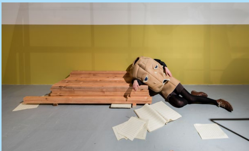
Eva Kořátková: Rozhovory s monšтром / Interviews with the Monster , 2021, látkový kostým s otvormi na ruky a krk / fabric costume with holes for arms and neck, 110 x 105 cm, záber z výstavy Rozhovory s monšтром / view from the exhibition Interview with the Monster , MeetFactory, Praha / Prague, foto / photo: Studio Flusser