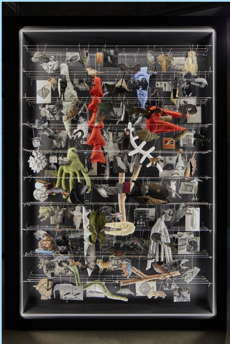
Eva Kořátková: Diár č. 2 (I-zviera) / Diary no.2 (I-Animal) , 2018, mediálne rôznorodá inštalácia / mixed media installation, vitrína, šnúra, papier, svetlo / vitrine, string, paper, light; záber na inštaláciu v Pirelli HangarBicocca / installation view at Pirelli HangarBicocca, Miláno / Milan