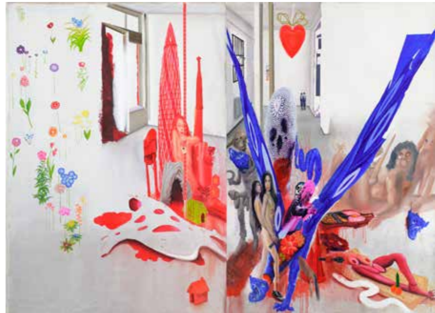
1 JIŘÍ PETRBOK: Objekt Žranice , 2012, akryl na plátne, 300 x 440 cm, majetok autora

Súvislosť vzniku romantických prejavov a inverzného konania má svoje identifikovateľné príčiny. Väčšinou ich vyvolá nejaká konkrétna situácia, ktorej povaha môže byť čisto osobná, intímna, bytostná, ale aj spoločensky či historicky podmienená. Často sa v tejto súvislosti používa pojem kríza, ktorá sa