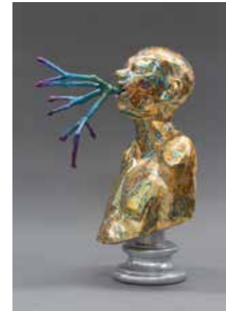
3 RICHARD ŠTÍPL: In the beginning was the Word , 2018, objekt – drevo, hliník, živica, plátkové zlato, metalická farba, 40 x 20 x 19 cm, majetok autora, foto: Josef Zlamal

„Inverzné postupy v súčasnej vizuálnej kultúre, (...) majú schopnosť vymedzovať sa a obhajovať svojbytný autorský priestor na slobodnú tvorbu i v nehostinnom prostredí.“