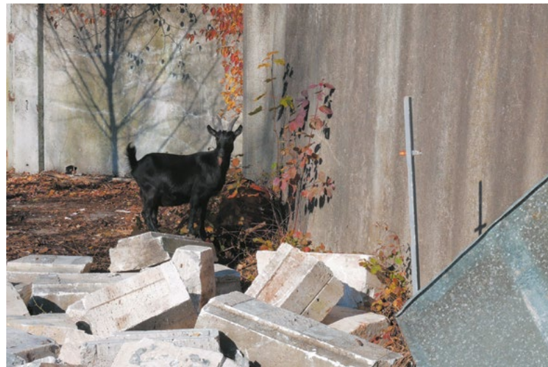
Matej Gavula: Promenáda v Čiernom lese / Promenade in the Black Forest , 2021, krátky film / short movie, 7:11 min., kamera a strih / camera and editing: Denis Kozerański, technická spolupráca / technical support: Ján Gašparovič

slov Gavulu odkazujú i na obranné valy, či na rímske bojové umenie, dokonalú vojenskú stratégiu založenú na prstencovej kruhovej obrane. Inštalovaná v centre mesta pri Kunsthalle Bratislava, funguje skôr ako metaforická obrana voči gentrifikácii a ignorovaniu histórie.