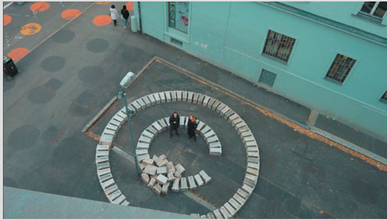
Matej Gavula: Promenáda / Promenade , 2021, inštalácia vo verejnom priestore / installation in public space, foto / photo: Denis Kozerawski

between present and past,” and also one of the city’s last urban “redoubt[s] in which to exercise the liberty of the individual or the small group.” 5