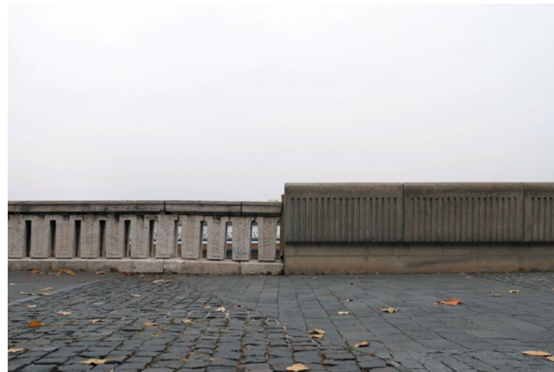
Matej Gavula: dokumentačný záber z dunajskej promenády / documentary shot from the Danube Promenade, 2021, foto / photo: archív autora/ author's archive

výška a forma síce chránia mesto pred tisícročnou vodou, súčasne však znemožňuje bližší kontakt peších na promenáde s riekou. 4 Celým 19. a 20. storočím sa vinú pokusy o urbanistické a architektonické zjednotenie nábrežia a snahy prepojiť ho s centrom mesta. Doposiaľ sa však prístup k spravovaniu a plánovaniu dunajských nábreží javí ako značne nekoncepčný a čiastkový. Ako sa uvádza v publikácii Bratislava (ne)plánované mesto , fragmentárne zásahy spôsobovali, že územie chátralo. Nábrežie tak až do minulého storočia ostalo „privilegovaným miestom identity, stretnutia súčasnosti a minulosti“ a zároveň jednou z posledných mestských „pevností, kde možno realizovať slobodu jednotlivca alebo malej skupiny“. 5