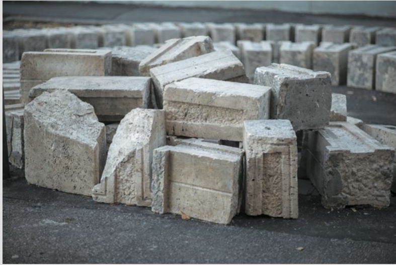
Matej Gavula: Promenáda / Promenade , 2021, intervencia do verejného priestoru / intervention in public space, detail / detail