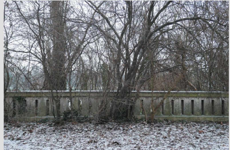
Matej Gavula: dokumentačné zábery z dunajskej promenády / documentary shots from the Danube Promenade, 2021