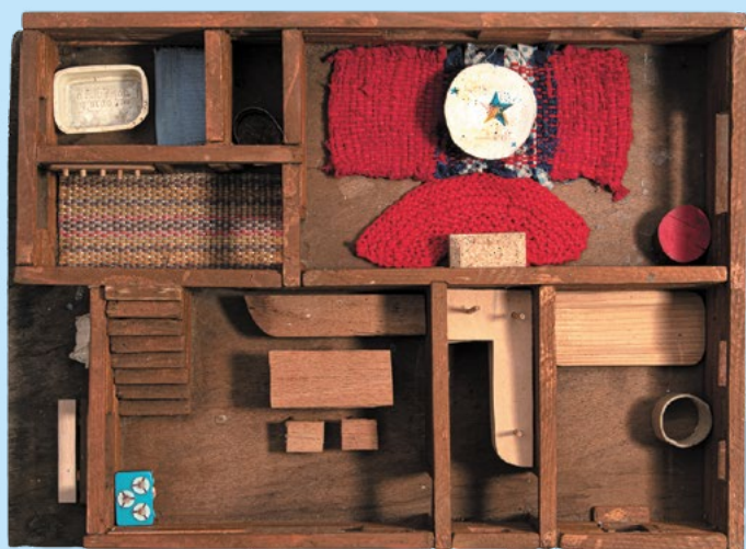
Juraj Gábor: Drevenica / Wooden Cottage , okolo 1997 – 98 (12 – 13 r. / 12 – 13 years), objekt / object, majetok autora / courtesy of the artist