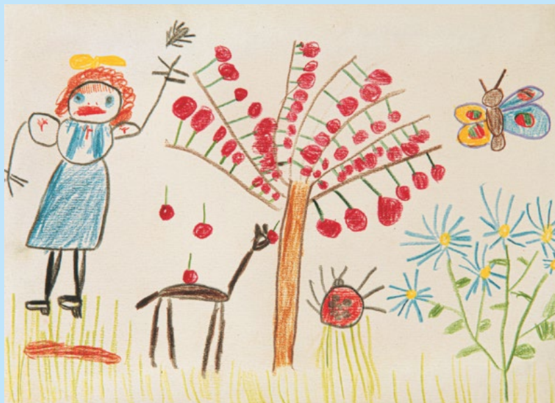
Květa Fulierová: Bez názvu / Untitled , 1936 (vek 4 r. / 4 years), majetok autorky / courtesy of the artist