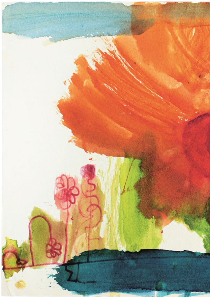
Peter Barényi: Praslička polná (Egrusetum Arvense) / Field Horsetail , okolo / around 1982 (vek 4 r. / 4 years), majetok autora / courtesy of the artist, foto / photo: Ema Lančaričová