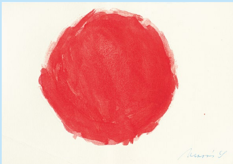
Stano Masár: Bez názvu / Untitled , okolo / around 1976 – 1977 (vek 4 – 5 r. / 4 – 5 years), majetok autora / courtesy of the artist