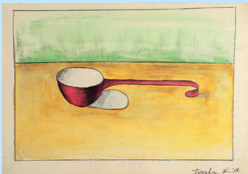
Otis Laubert: Varecha / Cooking Spoon , 1958–61 (vek 12 – 15 r. / 12 – 15 years), majetok autora / courtesy of the artist, foto / photo: Ema Lančaričová

a special category were the artists from artists' families, who from childhood onwards had seen their parents at work and knew the positives and risks of this profession (V. Rónaiová, D. Krajčová).