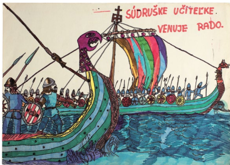
Radovan Čerevka: Súдруške učiteľke / Devoted to Comrade Teacher, 1988, (vek 8 r. / 8 years), majetok autora / courtesy of the artist