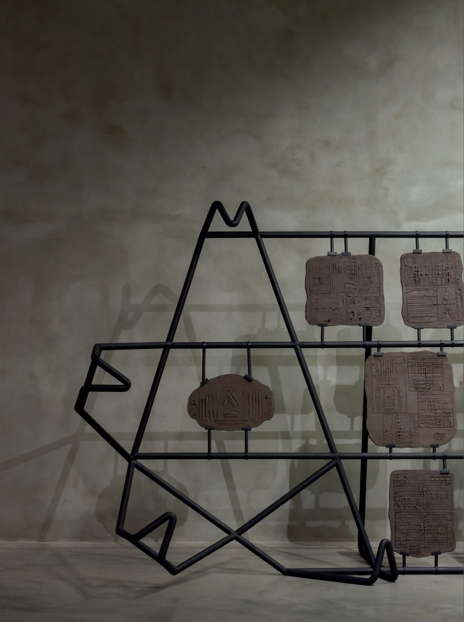
Radovan Čerevka: Zvezda („Kto sa hrá, nehnevá.“ / “Who plays is not naughty.”), 2017, kov, keramika / metal, ceramics, 570 × 200 × 120 cm