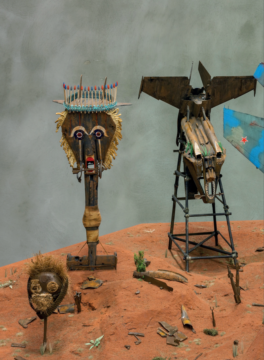
Radovan Čerevka: Dramasks , 2017, plast, akrylové farby, piesok, drevo / plastic, acrylic colours, sand, wood, 160 × 160 × 48 cm, foto / photo: Jakub Hauskrecht