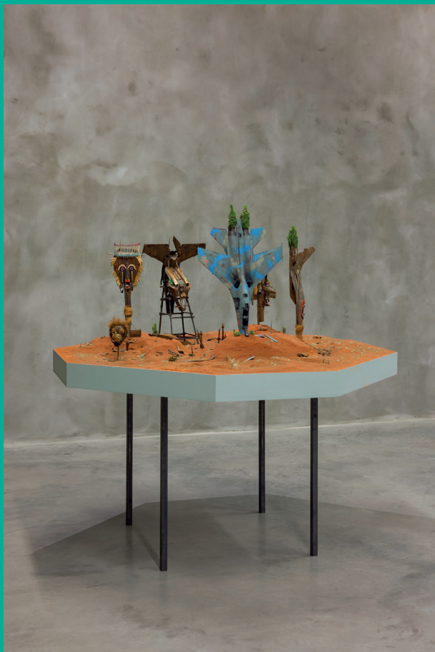
Radovan Čerevka: Dramasks , 2017, plast, akrylové farby, piesok, drevo / plastic, acrylic colours, sand, wood, 160 × 160 × 48 cm, foto / photo: Jakub Hauskrecht