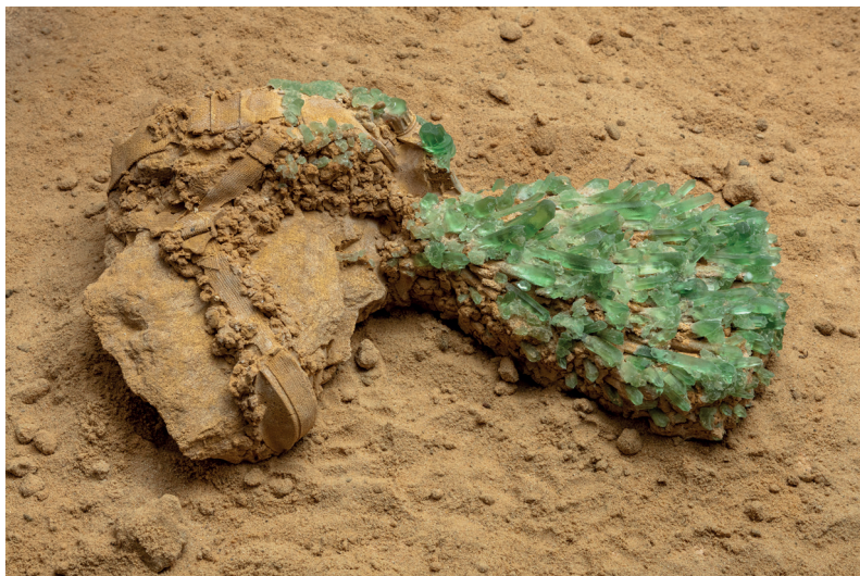
Radovan Čerevka: Environment A (fragment diela zo série 7 objektov / fragment of the artwork from the series of 7 objects), 2020, séria 7 objektov, umelý kameň, piesok, zelené neónové osvetlenie / series of 7 objects, artificial stone, sand, green neon lights, variabilné rozmery / variable sizes

na „pláži“ posilňuje úvahy o fenoméne tzv. „kargo kultu“. Vedľajším efektom, alebo skôr, výsledkom storočnej európskej kolonizácie bola skutočnosť, že niektoré dekontextualizované predmety každodennej potreby sa stali relikviami iných kultúr, ktoré ich rekontextualizovali a naplnili úplne inými mýtickými významami. Takto sa úplne náhodne objavujúce sa predmety bežnej domácej spotreby stávajú symbolmi a kultovými artefaktmi iných kultúr. „Kargo“ (z anglického slova „náklad“) ležiace na umelcovej „výživovej“ pláži taktiež nie je možné vnímať a chápať z pohľadu našej súčasnej logiky, nakoľko obsahuje informácie z „budúcnosti“, ktoré nedokážeme úplne spracovať a dekódovať. Takto