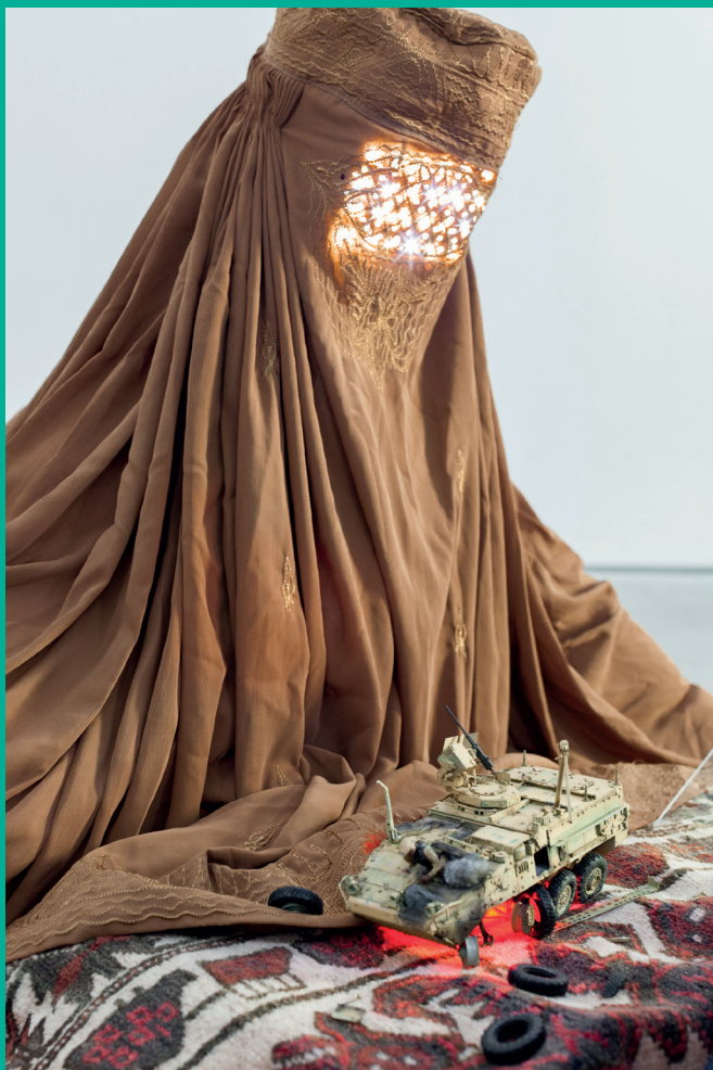
Radovan Čerevka: Trouble patrol , 2015, afganský vojenský koberec, islamské burky, plastové modely, fotografický archív slovenského príslušníka ISAF, infografické tlačie, atď. / Afghan war rug, islamic burqas, plastic kits, photographic archive of slovak ISAF soldier, lights, infographic prints, etc., variabilné rozmery / variable sizes, foto / photo: Miklós Surányi