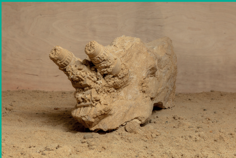
Radovan Čerevka: Environment A (fragment diela zo série 7 objektov / fragment of a work from a series of 7 objects), 2020, umelý kameň, piesok, zelené neónové osvetlenie / artificial stone, sand, green neon lighting, variabilné rozmery / variable dimensions

We can also witness that the work of Čerevka, which was already changing and departing from more directly critical works, has evolved into an art production based on instinctive research and visceral reality-checks.