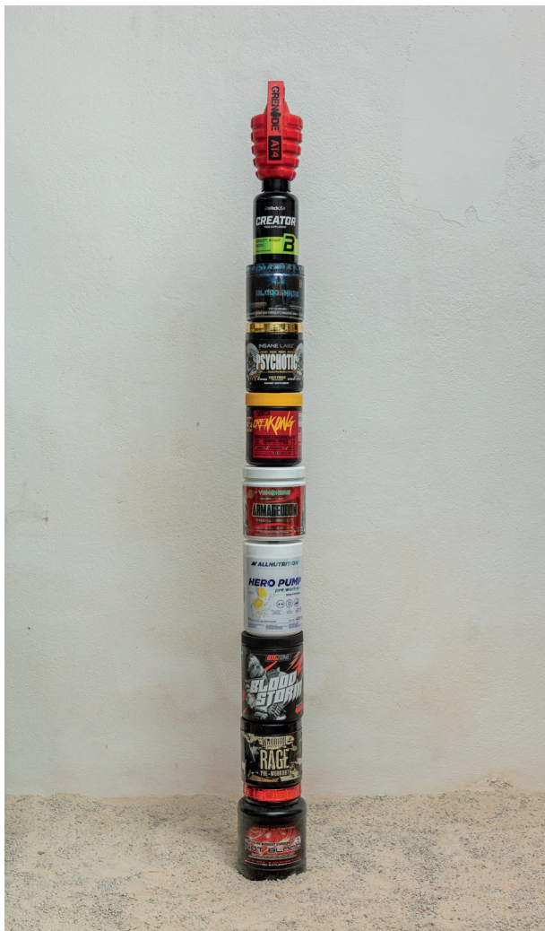
Radovan Čerevka: Pillars of heroes , 2020, nádoby proteínov a fitness prekurzorov / canisters for proteins and fitness precursors, 150 × 50 × 50 cm