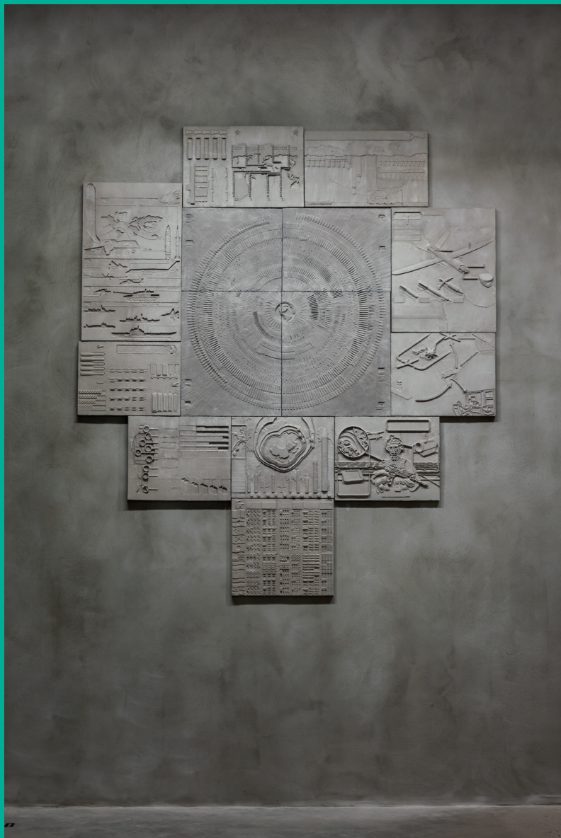
Radovan Červka: Brutalist truths , 2018, betón, plast, drevo / concrete, plastic, wood, 200 × 265 × 3 cm