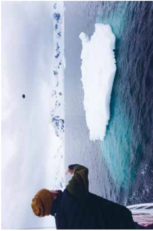
1 David Böhm, Jiří Franta: z cyklu Madžary , 2015, digitálna tlač, B1, majetok autorov David Böhm, Jiří Franta: from the Overtime cycle , 2015, digital print, B1, courtesy of the artists