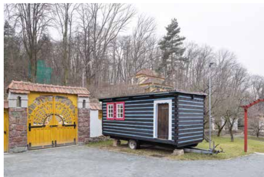
1 ANNA TRETTER: Na ceste – Malé domčeky autobusových zastávok, 2004/2018, inštalácia (digitálna prezentácia fotografií a kresba na stene), variabilné rozmery, majetok autorky, foto: archív autorky