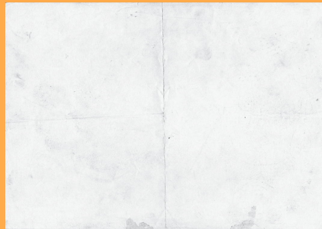
Kresba podľa diela Kateřiny Šedéj: 2016, 2016

Utečenci sa často plavia na lodiach a člnoch po mori, čo je veľmi nebezpečné. Kateřina Šedá preto vymyslela špeciálne plávacie vesty – pre koho by mohli byť určené?